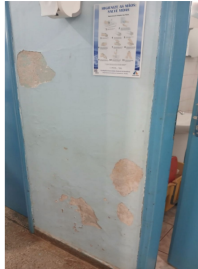
FOTO 2- CORREDOR