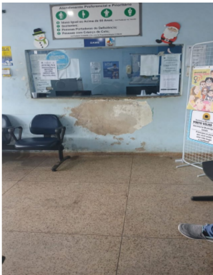
FOTO 1- RECEPÇÃO

Um exemplo desta situação, é a Unidade de Saúde da Família Agenor de Carvalho, conforme o eDOC B48A8F45 (43), vejamos: