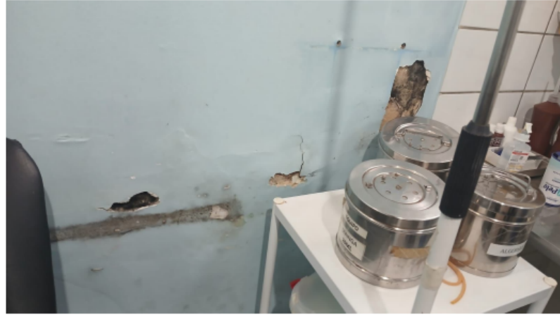
FOTO 5- SALA DE TRIAGEM

Dessa forma, ressaltamos que a falta de condições adequadas no ambiente de trabalho compromete o direito à saúde e à segurança, ao expor pacientes e servidores públicos a um ambiente insalubre, que pode acarretar agravos à saúde e aumentar o risco de infecções. Além disso, essa situação impacta negativamente a motivação e o desempenho dos profissionais, prejudicando a qualidade do atendimento. Torna-se, portanto, urgente a adoção de medidas que regularizem as condições estruturais e de limpeza, garantindo um ambiente seguro, digno e adequado para todos.