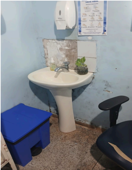
FOTO 4 - CONSULTÓRIO 2